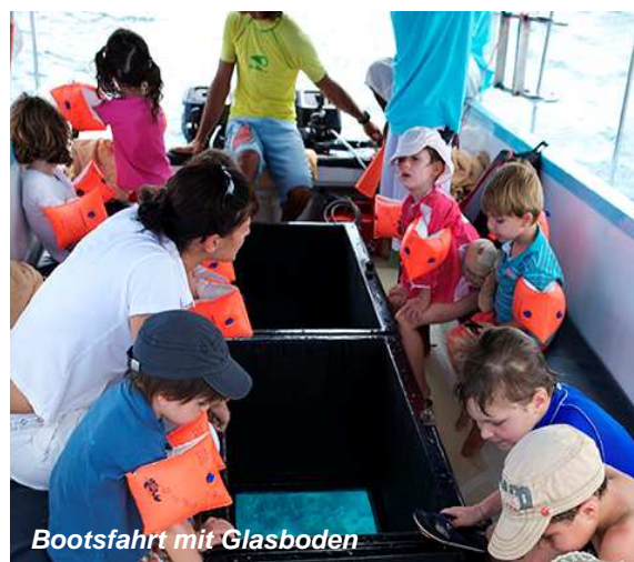
Bootsfahrt mit Glasboden