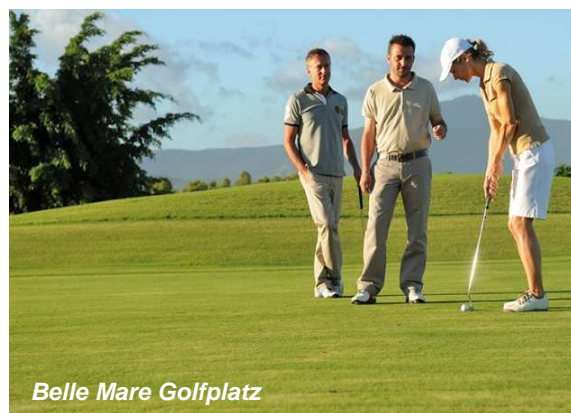
Belle Mare Golfplatz