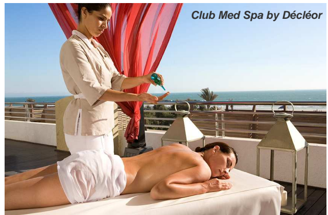
Club Med Spa by Décléor