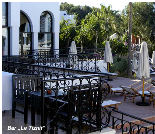
Bar „Le Tiznit“