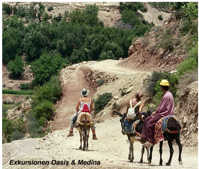
Exkursionen Oasis & Medina